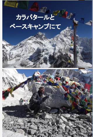
カラパタールと ベースキャンプにて

南アでパスポートを増刷した時が『折り返し地点』、ここが『旅のゴール』、日本は『終着地』。人生の旅は…、生きている限りまだまだ続けられる。